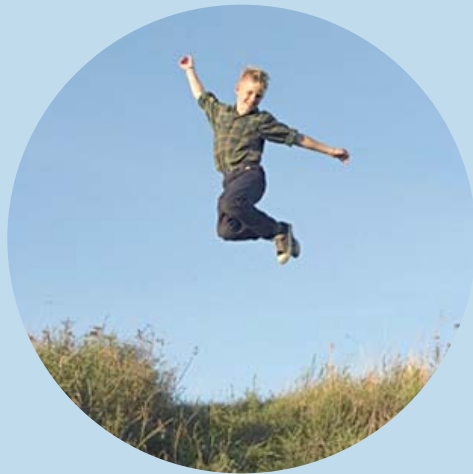
Drømmen. Nordisk Film Distribution

Denne folder har til formål at oplyse om, hvordan man bedst muligt kan komme fra idé til handling ved opstart af en filmklub for børn og unge.