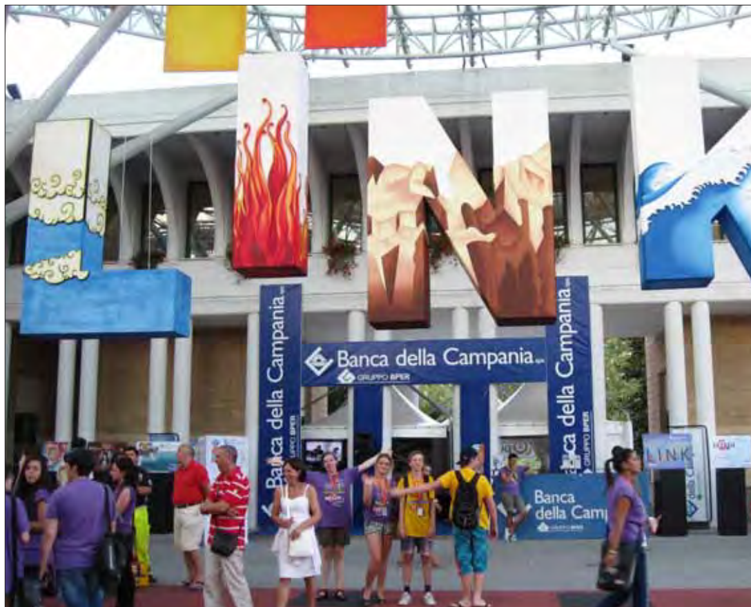
Den danske jury under årets tema - LINK

Det bliver tydeligt for enhver, at vi alle er forbundne, når man deltager i Giffoni Film Festival