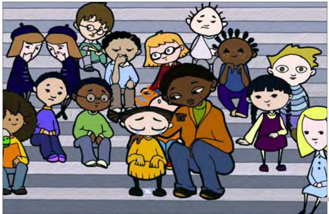
Fra den canadiske filmperle Talespinners – korte animationsfilm til de yngre.

Til filmoplevelsen hører oplæg. Oplægsholderne spiller en stor og vigtig rolle, og danner desuden ramme om diskussionen og det fælles kulturmøde i biografen. Oplægsholderne har alle en stor viden og erfaring på det område, filmen berører, og er med til at levendegøre filmoplevelsen og filmens tematikker. De skaber et levende kulturmøde, og muliggør, at publikum kan udtrykke, møde og erfare gennem dem og deres oplevelser og erfaringer i forhold til filmens hovedperson, tematik og historie. Således giver oplægsholderne filmoplevelsen en ekstra dimension, og bringer filmens historie inden for rækkevidde, hvilket er med til at levende- og synliggøre tematikken endnu mere.