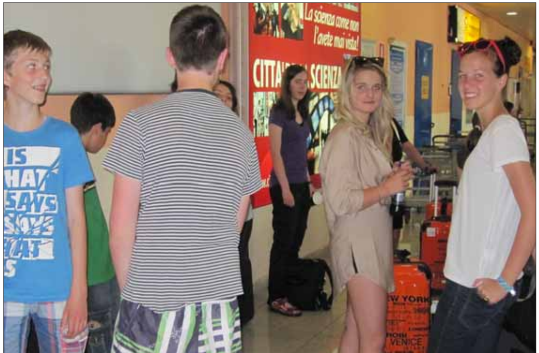
Vi venter i Napoli lufthavn på bussen til Giffoni

Næste dag kørte vi igen til festivalen efter at vi havde spist morgenmad. Nu skulle vi se filmen The Art of get-