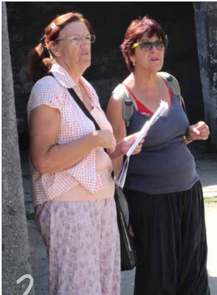
Danmark og Israels chaperoner snakker om de skønne unge, de har med