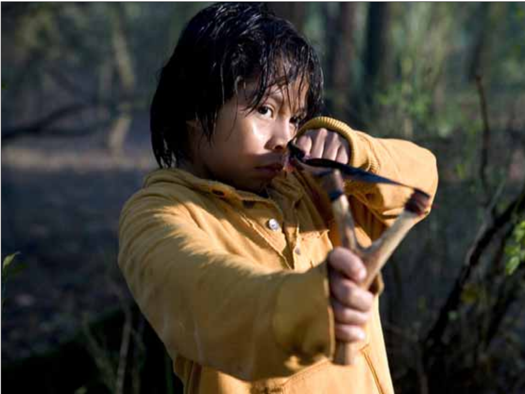
Fra Holland har Salaam importeret Indianeren, om et adoptivbarns selverkendelse, der nu også kan opleves på dansk.

for de positive aspekter. De får derigennem mulighed for at opleve glæderne ved kulturmødet og den flerkulturelle baggrund, både gennem film og oplægsholdere.